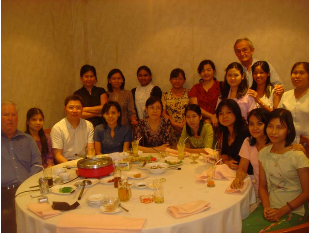
Une brochette de panseuses, formée à Créteil, et à l'école des panseuses de l'AP-HP

En fait je ne sais trop quoi leur dire pour les encourager, la situation générale du pays étant à l'évidence responsable de ce profond mal être. Mais à ma plus grande surprise le meilleur commentaire viendra de mon ami chinois. Silencieux pendant tout le dîner, il finira par dire : « like China 30 years ago ! Look today ! ». Et cela est bien vrai : il y a trente ans, que dis je, il y a dix ans, la situation en Chine était à désespérer. Aujourd'hui, tout a bougé : partout de très beaux hôpitaux, l'explosion de la chirurgie cardiaque, l'impression que tout est possible. Et pourtant, personne n'a jamais en haut lieu dit quoi que ce soit. Au communisme le plus strict a fait suite, insensiblement, un esprit de libre entreprise, un capitalisme pur et dur, l'envie de progresser. Tout est venu de la base ! Travailler plus, et plus encore, se défoncer sans retenue, tels ont été les moteurs du changement. La recette est elle applicable au pays ?