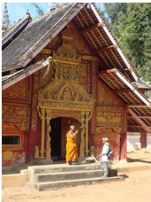
Un petit monastère su 16 ième siècle dans le fin fond de l'état Shan

Les moines professionnels, à temps plein, indiquent à la population le chemin à suivre pour vivre « bien » c'est-à-dire suivre les recommandations de bouddha. Ceci va m'obliger à vous parler du bouddhisme !