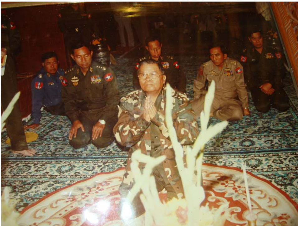
Photo de l'Autorité en visite à la grande pagode Mahamoudi, à Mandalay, exposée à l'entrée principale.

L'influence politique tout d'abord. Elle est considérable, même si parfois, on est frappé par une apparente bonne entente entre moines bouddhistes et pouvoir politique en place.