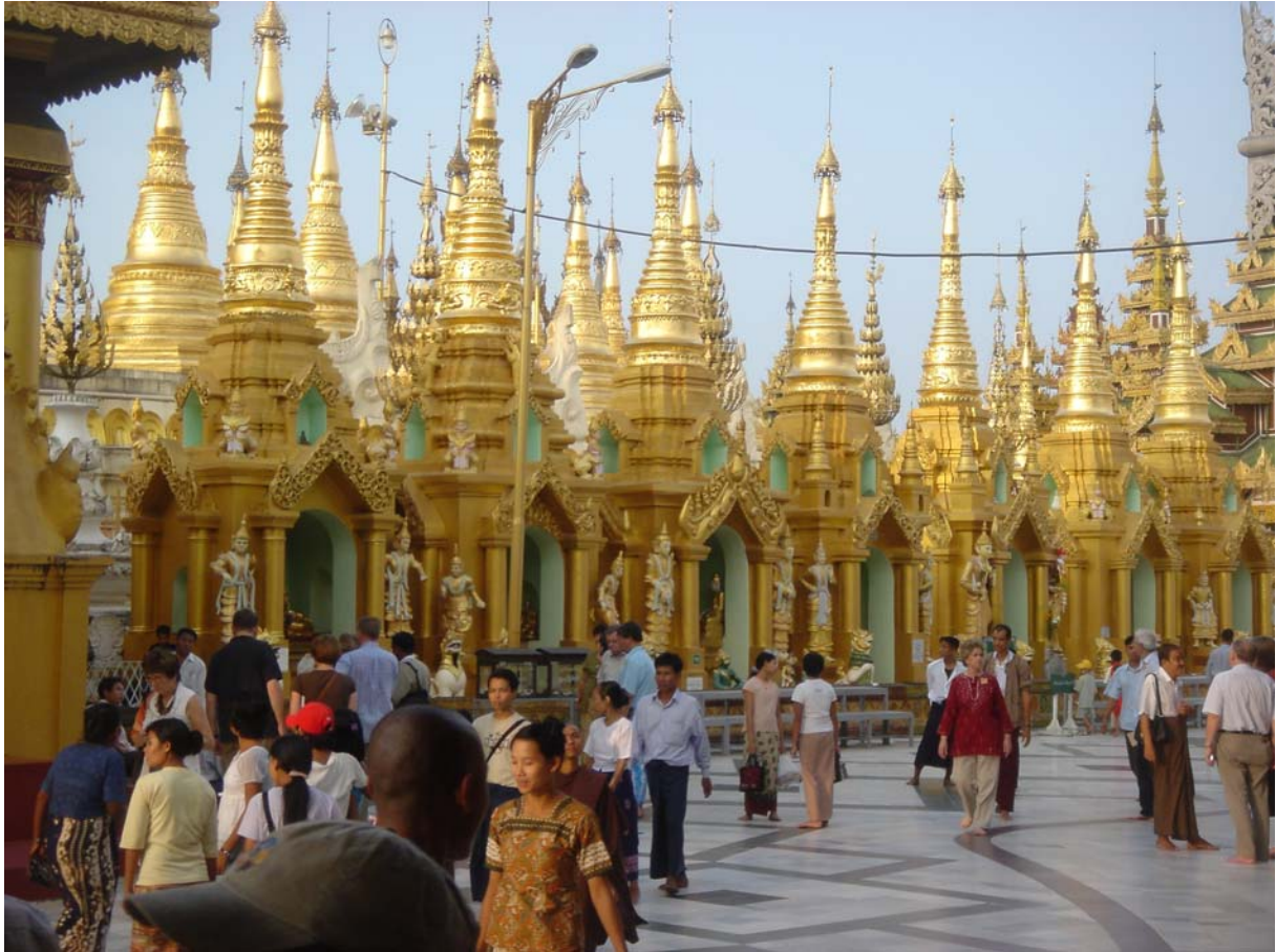
La pagode Swedagon à Yangon rassemble chaque jour la population de la ville et les nombreux pèlerins. Pour nous, la visite est un moment de grand calme.

Le plus frappant est le temps que le birman consacre à la méditation. Quelque soit le métier, le birman sait ménager dans sa journée le temps de la concentration et de la réflexion. Ces périodes ne durent pas nécessairement très longtemps. Elles permettent à chacun de prendre le recul nécessaire devant les événements les plus anodins de l'existence. Elles aident à chercher à faire le bien et ce quelque soit l'environnement, à penser à l'impact sur autrui de ses propres actions, de son propre comportement. Bien sûr, ceci est parfois dérisoire voire choquant. J'ai souvenir des conséquences désastreuses chez un malade d'une décision de l'un des médecins de l'hôpital. Il se dédouanait de sa responsabilité en évoquant un mauvais karma, celui du malade et le sien ! Ce qui m'a franchement énervé ! Facile, trop facile ! S'il avait fait un petit effort, pris la peine de prendre en considération tous les paramètres cliniques du malade, il aurait peut être pris une meilleure décision et évité la catastrophe ! Le fait que dans la vie tout soit conditionné et que l'homme a peu d'action sur le cours des choses a parfois bon dos ! Mais dans l'ensemble, ce souci permanent de faire le bien donne au fonctionnement en communauté beaucoup de fluidité, beaucoup de sérénité. Le « nous sommes très pauvres, peut être, mais nous sommes surtout très riches ....dans notre cœur » est un commentaire qui revient assez souvent, et ce dans les différentes classes sociales.