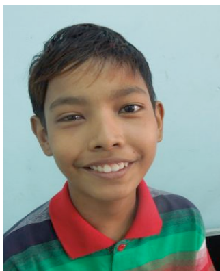
Moins de six mois après une intervention majeure sur ses valves aortiques, ce jeune garçon a retrouvé une vie normale