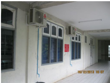
Refection des couloirs de la salle d'accouchement