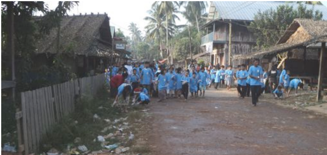
Les enfants de chaque centre de l'Orphelinat se lancent à l'assaut des déchets qui gâchaient les abords des maisons .

L'année s'est terminée par « LE CADEAU » que les 396 enfants ont fait pour exprimer leur reconnaissance : « LE CLEANING DAY ». Armés de t-shirts, de gants, de sacs poubelles, de poubelles offertes à la ville et aux villages, mais surtout de petites brochures explicatives distribuées à la population, ils ont nettoyés les abords de leurs centres. La petite brochure indiquait le nombre d'années nécessaires pour détruire un sac plastique ou un chewing gum, un L'opération a eu lieu à TALAING SU, K'LWIN, MA ZAW, PYIGYILMANDINE, BOTAUNG , WARCHAUNG ; A BOTAUNG , un village sur une île perdue ce fut une vraie révolution. Les enfants après une préparation éducative sur l'environnement et la pollution ont participé avec beaucoup de joie et d'enthousiasme. A MYEIK les autorités locales qui ont prêté main forte pour les camions de ramassage, ils ont demandé que cette manifestation se renouvelle l'année prochaine ; UNE MAGNIFIQUE REUSSITE