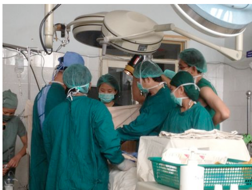
Dans l'unité de soins intensifs Post-opératoires, la chirurgie cardiaque à la lueur d'une lampe torche pendant les coupures d'électricité