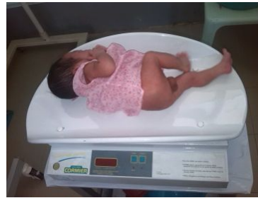
d'un pèse- bébé