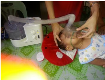
Utilisation d'un nébulisateur