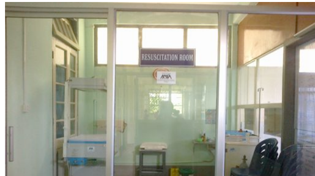
Salle de réanimation avant la couveuse