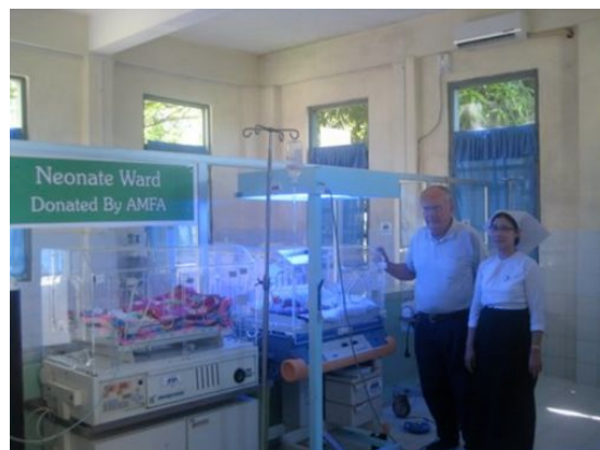
Nouvelle salle de NEOTALOGIE