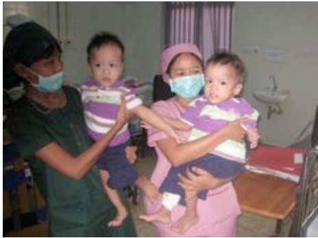
A Mandalay siamois séparés