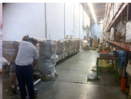
Impressionnant ce qui va partir