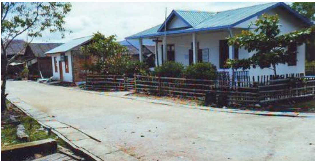
Pour la première fois , la rue n'est pas en terre et les drains sont entretenus.

Dans l'île de YAE KAU AW , le dispensaire a été repeint et remis à neuf, les portes et les fenêtres avaient été endommagées par la mousson. L'activité du dispensaire est bonne même si le nombre d'accouchement n'augmente pas car de nombreuses femmes accouchent encore à leur domicile comme le veut la tradition très respectée dans les îles.