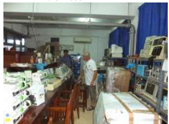
le « Workshop » ou Atelier de l'AMFA