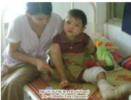
Cellulite du pied