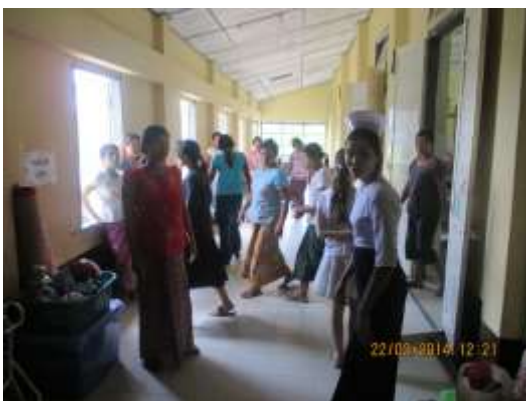
La famille envahit les couloirs