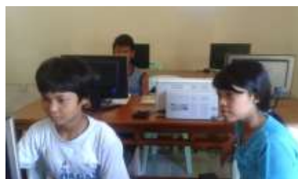
Classe d'informatique à l'Orphelinat de Myeik