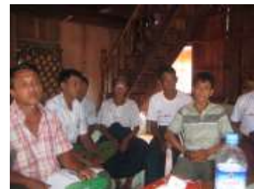
Réunion du Conseil Municipal