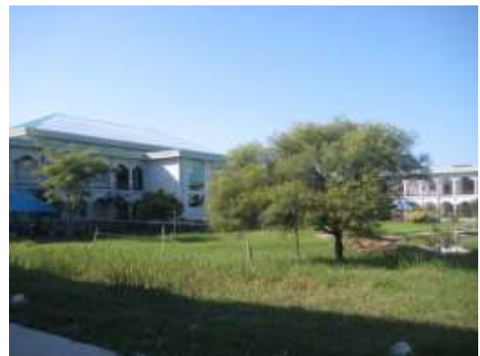
Agrandissement Hopital Orthopédique de