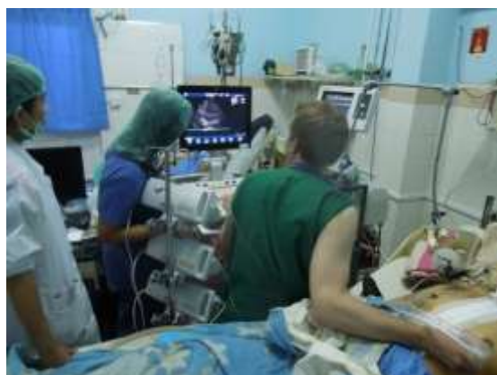
Formation à l'échocardiographie