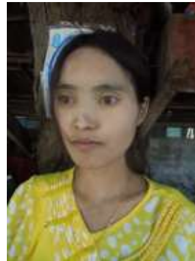
Deux opérés, l'un des coronaires l'autre de ses trois valves