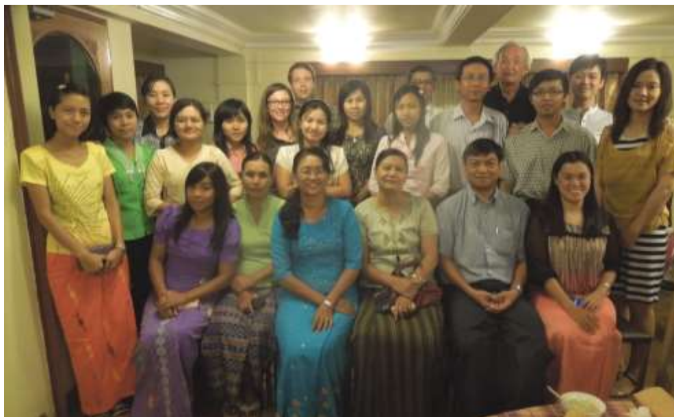
L'équipe au complet.