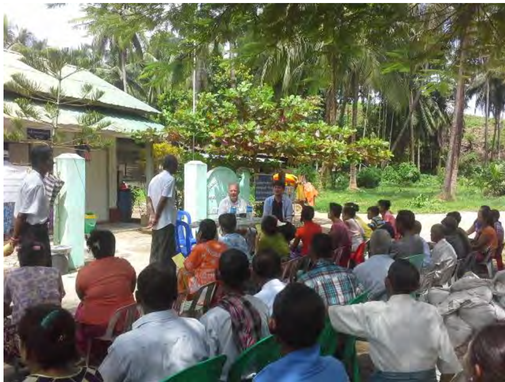
Cours de santé publique dans une des îles de Myeick

Les îles présentent toutes des problèmes d'hygiène par manque d'eau et également par le manque de traitement des ordures. Il y a également le problème des plastics amenés par les marées