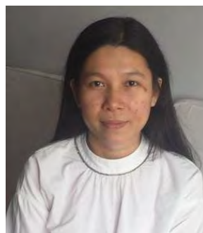
AYE AYE MON