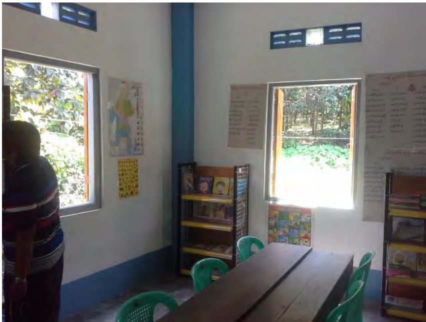
Bibliothèque des enfants