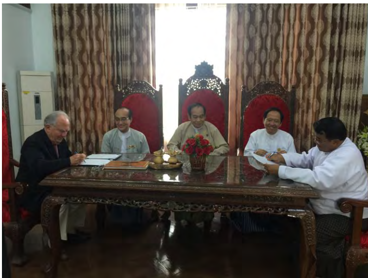
Signature des accords avec le Ministre de la Santé et le Recteur

Pour ce projet d'Ecole Nationale de Chirurgie, le rôle de l' AMFA est désormais d'établir le calendrier des missions et la composition des équipes enseignantes, de veiller au bon fonctionnement des équipements, éventuellement d'acheter quelques instruments ou matériel nécessaires, et d'essayer de trouver depuis la France des donateurs pour des instruments chirurgicaux et du matériel divers.