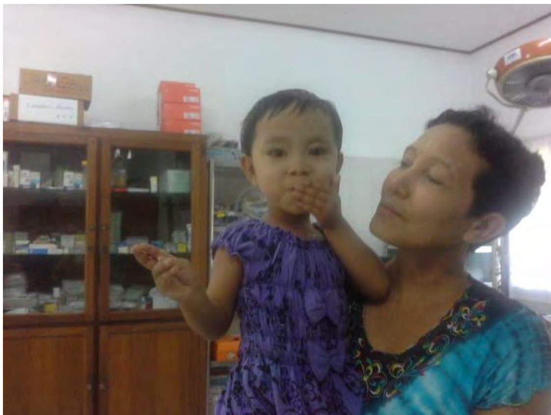
Petite fille 4 mois après son opération à cœur ouvert