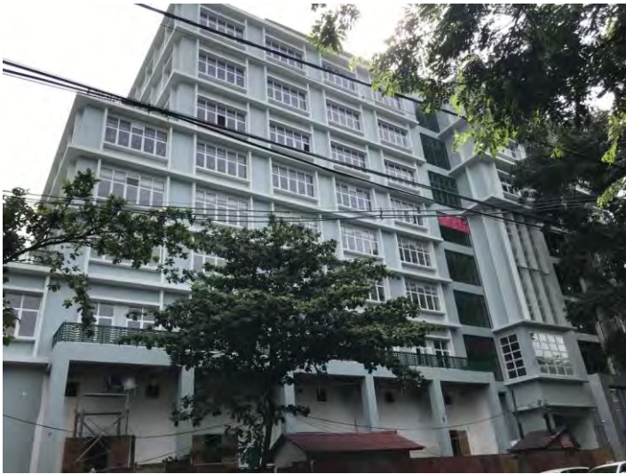
Le bâtiment en mars 2019