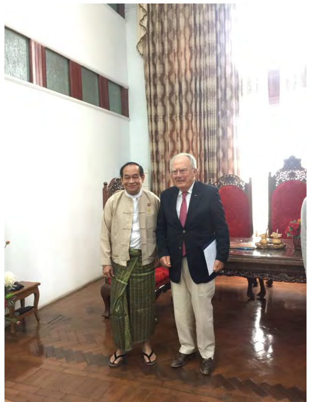
Les deux signataires

Pour mémoire l' AMFA a signé un accord de deux ans avec l'Université Médicale 1 de Yangon ainsi qu'avec l'université de Nancy et l'école de chirurgie de NANCY.