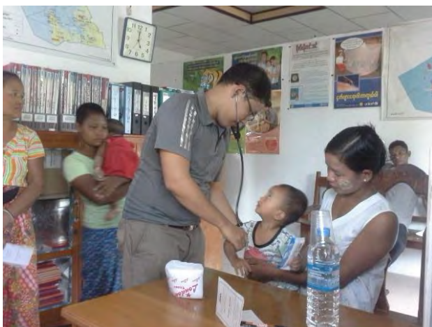
Il y a beaucoup d'enfants à soigner dans les villages

Les tests pour identifier les crises de paludisme sont donnés par le gouvernement ou achetés. Quant aux traitements pour la malaria, la tuberculose et la lèpre, ils sont délivrés par l'hôpital de la région en suivant un programme bien établi. Le fonctionnement de tous les dispensaires est identique et les soins dispensés sont les mêmes. Tout est gratuit. Les dispensaires sont réparés et repeints tous les deux ans