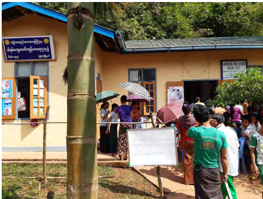
Beaucoup de consultants !

Comme toujours les pathologies habituelles sont le prurit diffus, les prurigos surinfectés, les mycoses importantes, les infections cutanées, les brûlures, les lichenifications secondaires, les pathologies buccales facilitées par le bétel, les érythèmes pigmentés fixes dus à la prise de phytothérapie, et le vitiligo.