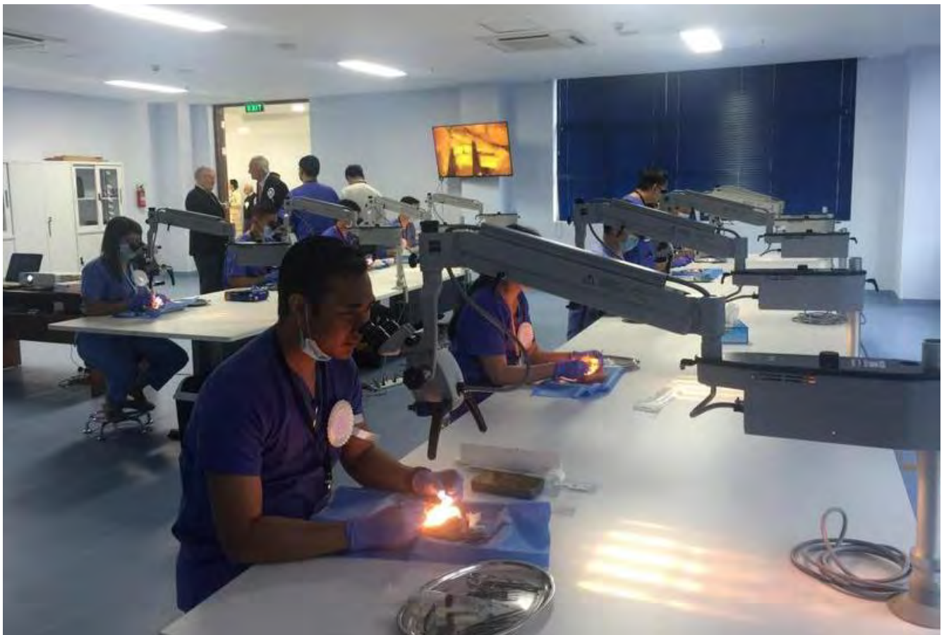
La salle de microchirurgie

Madame AUNG SAN SUU KYI (Conseillère d'Etat) a d'inauguré les locaux le 2 décembre. Elle a visité certaines salles, notamment la salle de microchirurgie entièrement équipée par l' AMFA grâce au soutien total de la Fondation IF (Suisse).