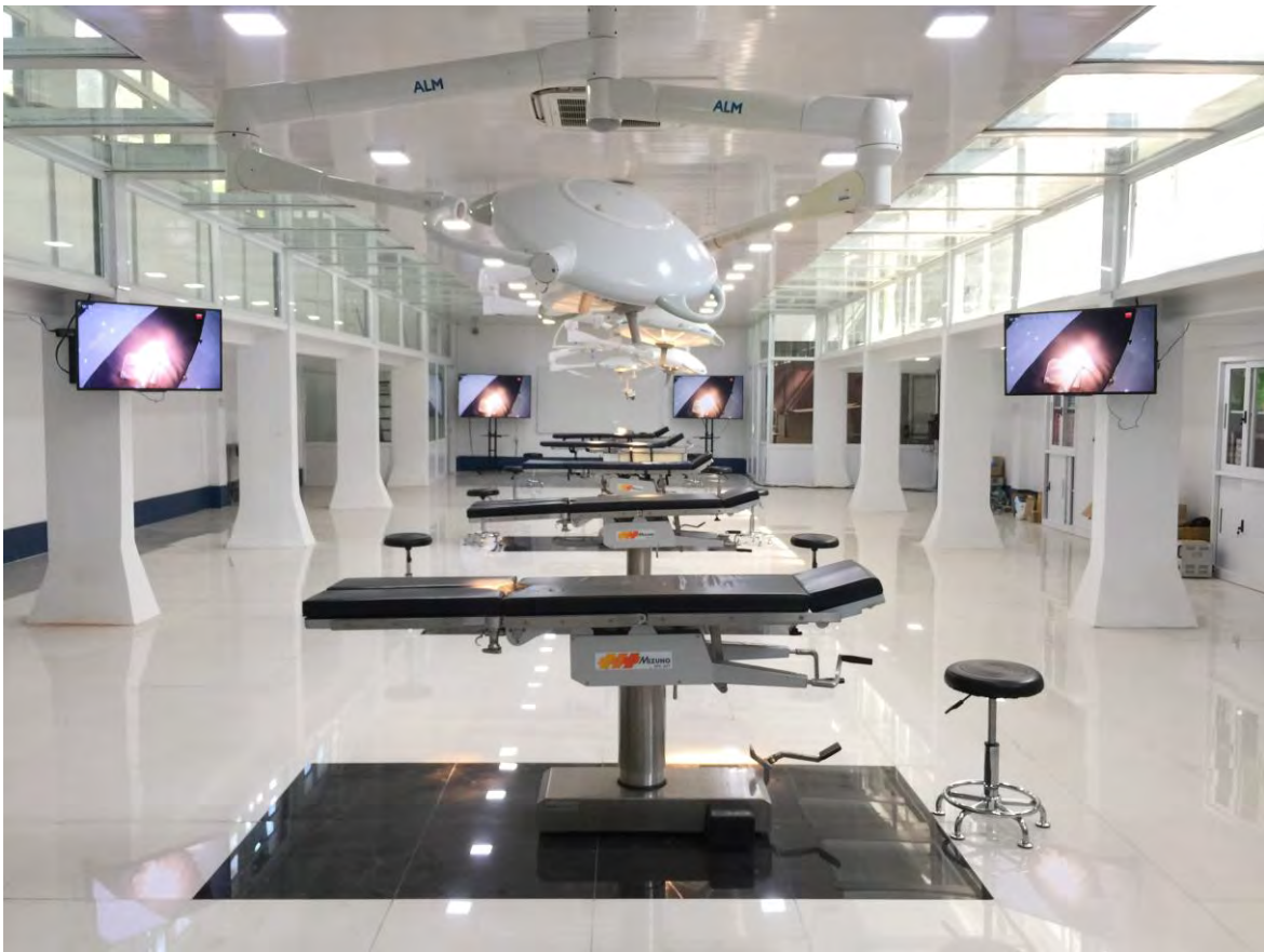
La salle de démonstration

Le premier cours de démonstration en chirurgie digestive (équipe du Pr PAYE , hôpital Saint-Antoine AP-HP) a eu lieu avec succès du 15 au 21 décembre. 25 auditeurs s'étaient inscrits.