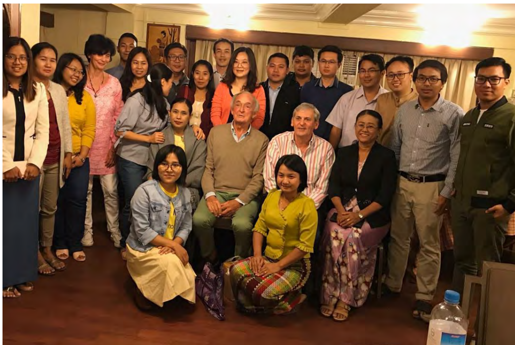
L'équipe a considérablement grandi.

La technique de formation repose beaucoup sur le compagnonnage. Les différents seniors de notre équipe transmettent leur expérience tant en salle d'opération que dans la période pré opératoire (la sélection des candidats à l'intervention, leur préparation) qu'après l'intervention, en unité de soins intensifs. Les résultats de cette formation sont évidents : l'équipe locale est devenue autonome dans la majeure partie des situations chez l'adulte. Près de trois cents interventions ont ainsi été réalisées en 2019. Le Pr NAKASHIMA , le Pr WAN , le Pr SONG , le Pr BAUFRETON , le Pr SARGENTINI , le Pr JEGADEN et le Pr LOISANCE ont participé en 2019 à cette formation sur site.