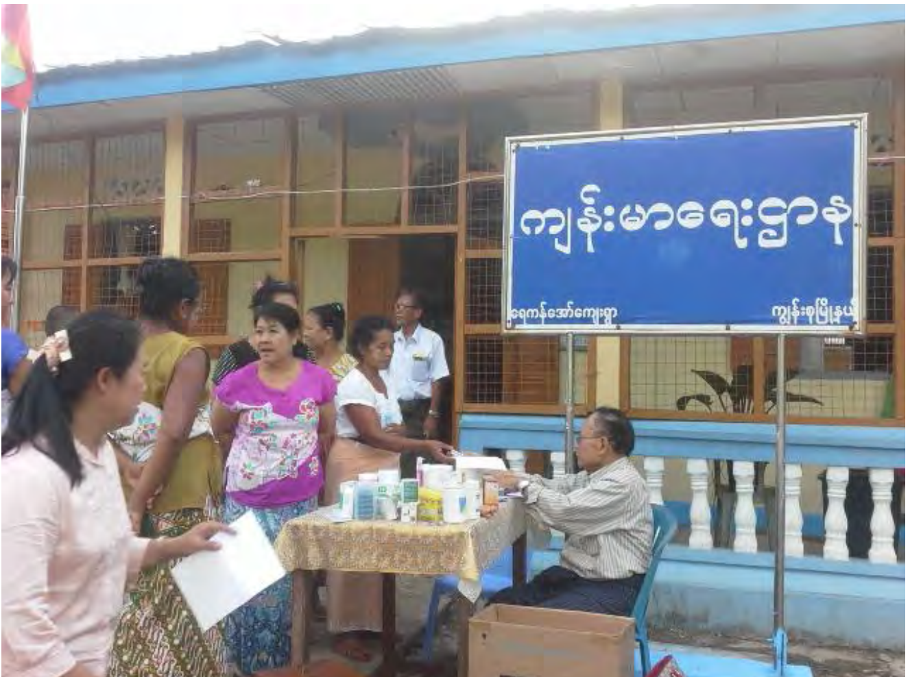
Distribution de médicaments après consultation

Le livre d'enregistrement des malades est régulièrement vérifié, et un livret médical est remis à chaque patient.