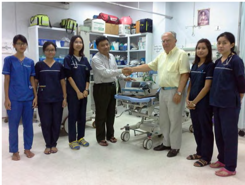
L'équipe du Service des Urgences de Yangon

Les urgences du Yangon General Hospital fonctionnent bien et les médecins urgentistes apportent un grand appoint dans tous les soins.