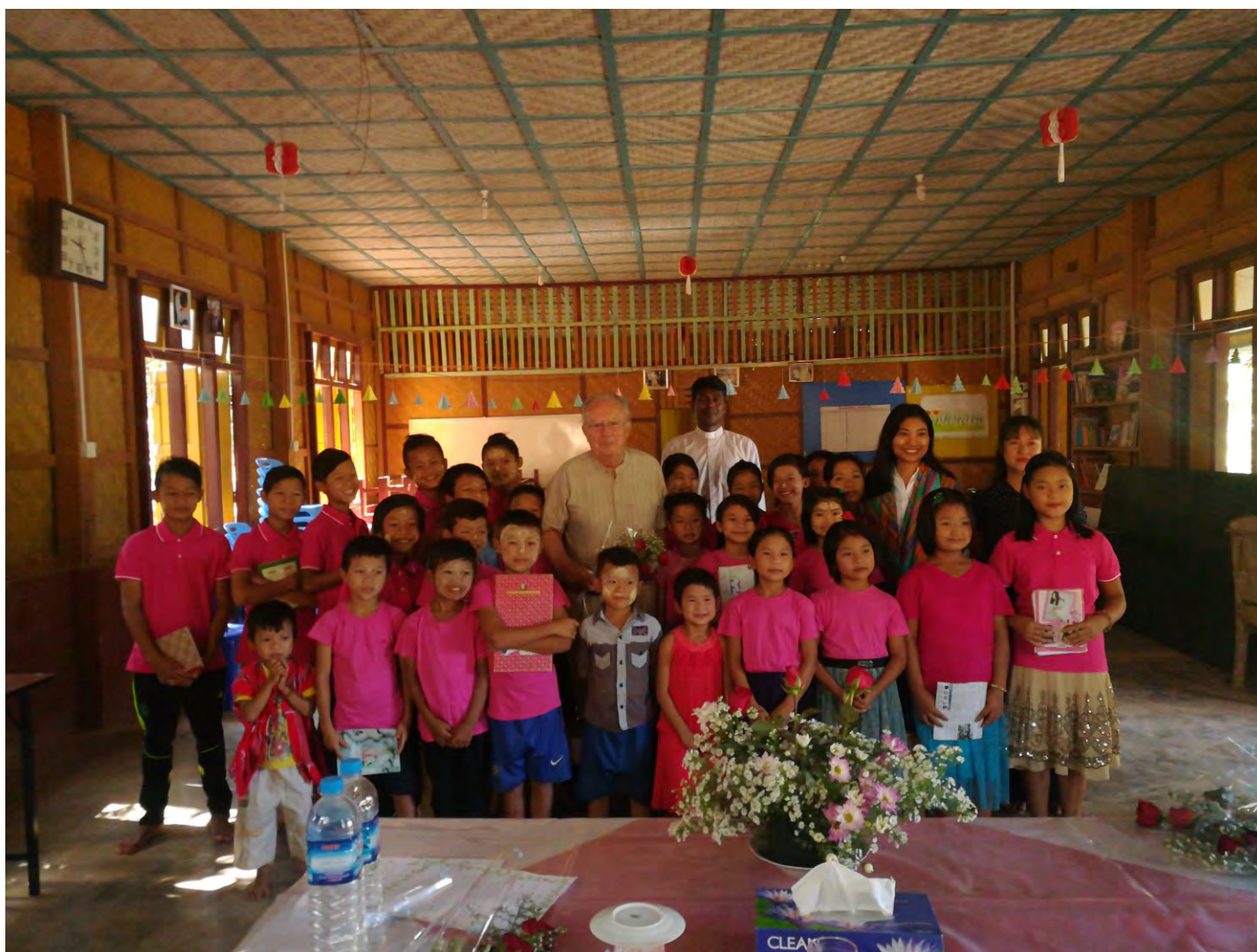
Enfants de Mazaw

Les résultats les plus visibles sont des enfants qui sont en bonne santé et qui semblent heureux. La pérennité du Fonds de dotation ALBERT ET YOLANDE BAUSSAN nous permet de continuer l'œuvre et les actions mises en place par les fondateurs dont nous nous efforçons de mémoriser les noms auprès des enfants et des adolescents.