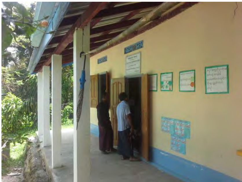
Salle de réunion des professeurs