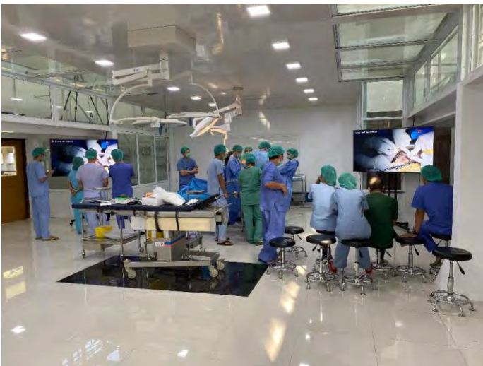
Le premier cours de chirurgie abdominale

Le premier cours de démonstration en chirurgie digestive (équipe du Pr PAYE , hôpital Saint-Antoine AP-HP) a eu lieu avec succès du 15 au 21 décembre. 25 auditeurs s'étaient inscrits.