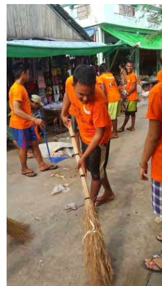
Nettoyage des rues

De nouveaux puits ont été forés : il n'y a donc plus de restriction d'eau mais par contre il n'y a toujours pas d'eau potable.