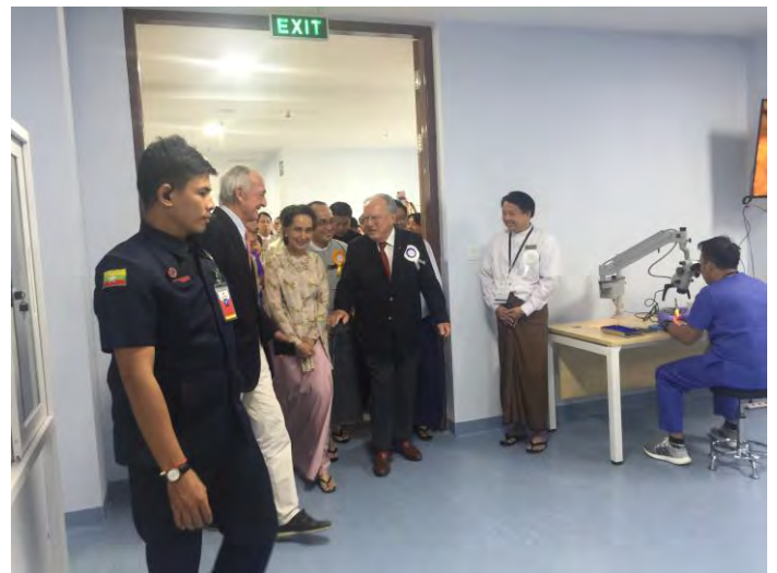
Inauguration le 2 décembre 2019

Madame AUNG SAN SUU KYI (Conseillère d'Etat) a d'inauguré les locaux le 2 décembre. Elle a visité certaines salles, notamment la salle de microchirurgie entièrement équipée par l' AMFA grâce au soutien total de la Fondation IF (Suisse).