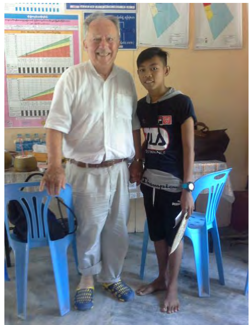
Pr Alain PATEL avec un patient opéré d'une valve il y a 5 ans par les chirurgiens cardiaques français