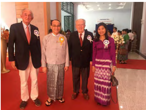
Le recteur de UM1 avec les représentants de l'AMFA