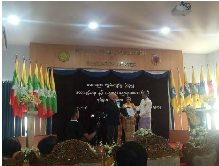
Remise des certificats de don pour l'AMFA et la Fondation IF

L'AMFA a choisi le chef électricien chargé de l'entretien et de la sécurité de toutes les salles. Il habite sur le campus. Il sera parfait pour l'entretien et la sécurité du site AMFA.