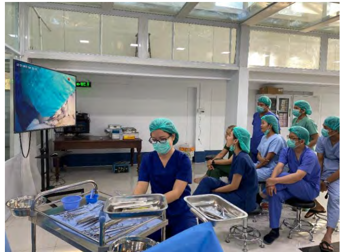
Les jeunes chirurgiens assidus