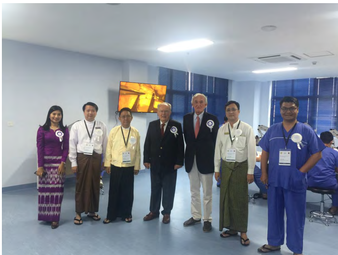
Equipe pour la microchirurgie de la main

Dix microscopes neufs, dont un relié à un écran de télévision, sont en place pour les démonstrations et l'entraînement des chirurgiens de toutes les spécialités.