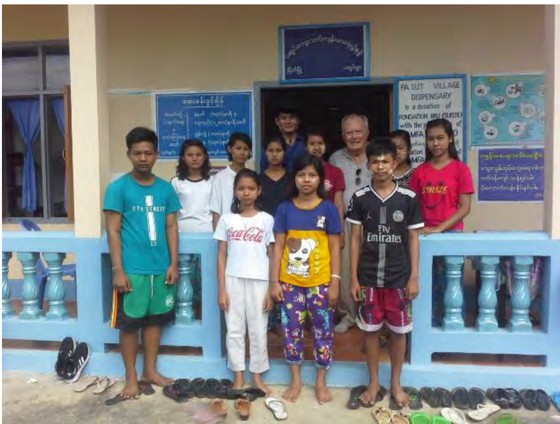
Elèves à l'école de « bachotage » 2019-2020

Il y a eu cette année encore un nouveau groupe de 9 élèves, candidats au « Bac » grade II (l'obtention de cet examen permet d'aller à l'université) qui ont pu aller à l'école de « bachotage » de Myeick pour obtenir de bons résultats. Pour le « bac » de cette année, 8 candidats sur 10, préparés dans cette école de « bachotage », ont réussi l'examen. La jeune fille du village, qui avait été envoyée à l'école hôtelière « Heritage Foundation » à Inlee a réussi et a un travail très correct dans un bon hôtel.