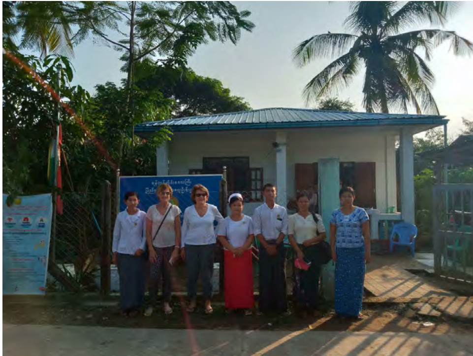
Toute l'équipe dans un dispensaire du delta