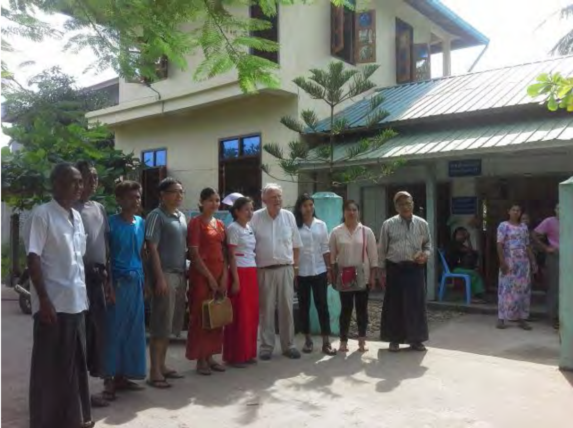
Une équipe franco-birmane dans un des dispensaires