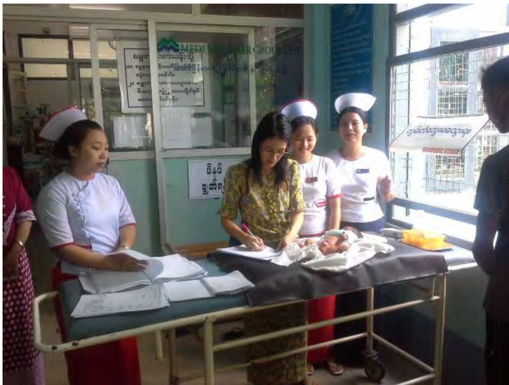
Tous les matins les nouveau-nés sont examinés

Pour l'unité de néonatalogie, cinq couveuses sont en état et des bébés d'à peine 1kg200 y sont « nursés ». Le bilirubinomètre cutané a été réparé en avril à Paris et la Fondation Rainbow Bridge vient aussi d'en acheter un second pour qu'il n'y ait pas de « carence ». Le concentrateur d'oxygène fonctionne bien. La Fondation Rainbow Bridge vient aussi d'acheter deux concentrateurs mobiles ce qui va aider à ne plus avoir de cylindres d'oxygène coûteux pour les familles.