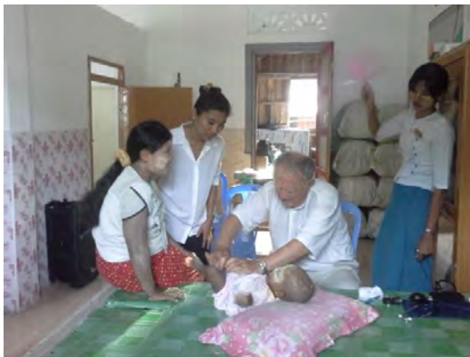
Examen d'un enfant au cours d'une mission

Les tests pour identifier les crises de paludisme sont donnés par le gouvernement ou achetés. Quant aux traitements pour la malaria, la tuberculose et la lèpre, ils sont délivrés par l'hôpital de la région en suivant un programme bien établi. Le fonctionnement de tous les dispensaires est identique et les soins dispensés sont les mêmes. Tout est gratuit. Les dispensaires sont réparés et repeints tous les deux ans